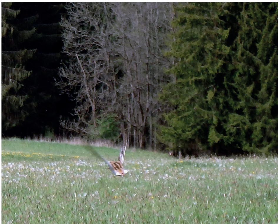
Obr. 6 – Bekasina větší ( Gallinago media) na zřejmě pravidelné tahové zastávce u Horního Dvořiště na Českokrumlovsku.

Fig. 6 – Great Snipe ( Gallinago media) at what is probably a regular stopover site, Horní Dvořiště, Český Krumlov district.