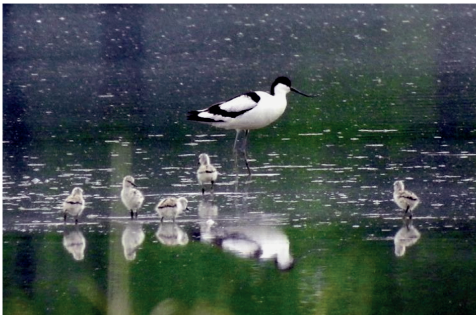
Obr. 5 – Rodinka tenkozobce opačného ( Recurvirostra avosetta) s nezvykle vysokým počtem pěti mláďat na rybníce Vyšatov u Křenovic.

Z roku 2020 z JČ pochází více než 100 záznamů tenkozobců (AOPK ČR 2021, ČSO 2021, eBird 2021, Observation International 2021), výše vybrané záznamy představují klíčové momenty hnízdění. Na Českobudějovicku v roce 2020 zahnízdilo 12 párů tenkozobců (9 párů na rybníce Vyšatov