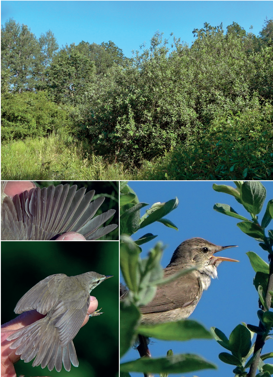
Obr. 3 – Rákosník pokřovní ( Acrocephalus dumetorum) u Silnického rybníka u Paštík: jeho biotop (nahore) a detaily vzhledu jedince (dole) při jeho pozorování a po jeho odchytu ( 28. 6. a 30. 6. 2020).