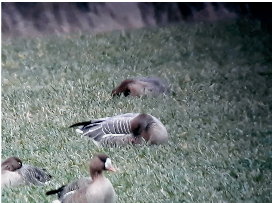
Obr. 1 – Husa krátkozobá ( Anser brachyrhynchus) v hejnu hus běločelých ( Anser albifrons) na poli u Dunajovic na Třeboňsku ( 14. 2. 2020).

Fig. 1 – Pink-footed Goose ( Anser brachyrhynchus) in a flock of White-fronted Geese ( Anser albifrons) in a field at Dunajovice in Třeboň district ( 14. 2. 2020).