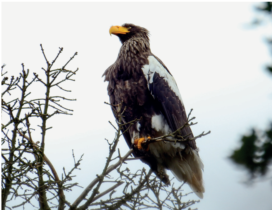
Obr. 7 – Orel východní ( Haliaeetus pelagicus) na lokalitě pravidelného výskytu v jižních Čechách, Chlumecké rybniční soustavě.

Fig. 7 – Steller's Sea Eagle ( Haliaeetus pelagicus) at a locality where it occurs regularly in South Bohemia, fishpond system near Chlum u Třeboně.