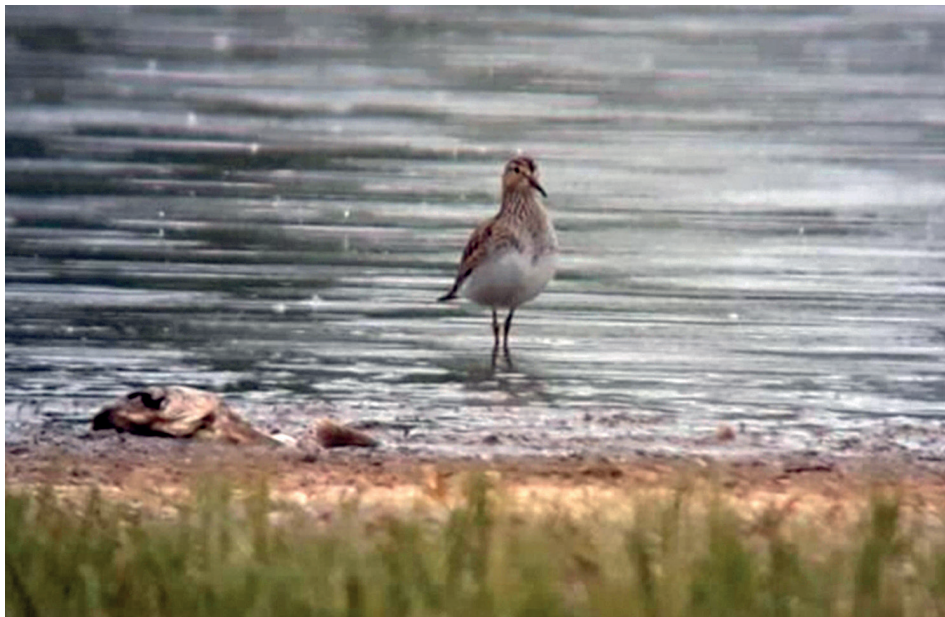
Obr. 2 – Jespák skvrnitý ( Calidris melanotos) na Novohaklovském rybníce u Českých Budějovic.