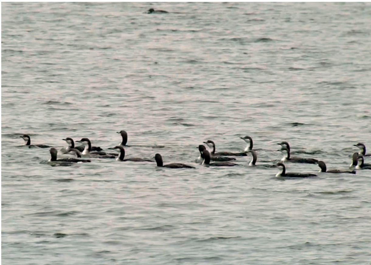
Obr. 1 – Část hejna potáplic severních ( Gavia arctica) na rybníce Řežabinec. Fig. 1 – Part of the flock of Black-throated Diver ( Gavia arctica) on Řežabinec pond.