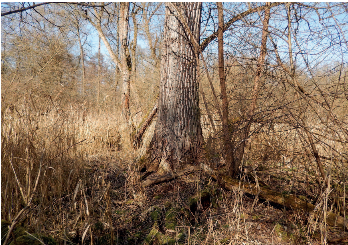
Obr. 1 – Strom s doupětem mývalů severních ( Procyon lotor ) u Hluboké nad Vltavou. V levé části úpatí kmene je patrný jeden ze vsuků (foto V. Mikeš, únor 2014). Fig. 1 – A tree with the northern raccoons' ( Procyon lotor ) hollow at Hluboká nad Vltavou. One of the entrances is visible on the left side of the trunk base (photo by V. Mikeš, February 2014).