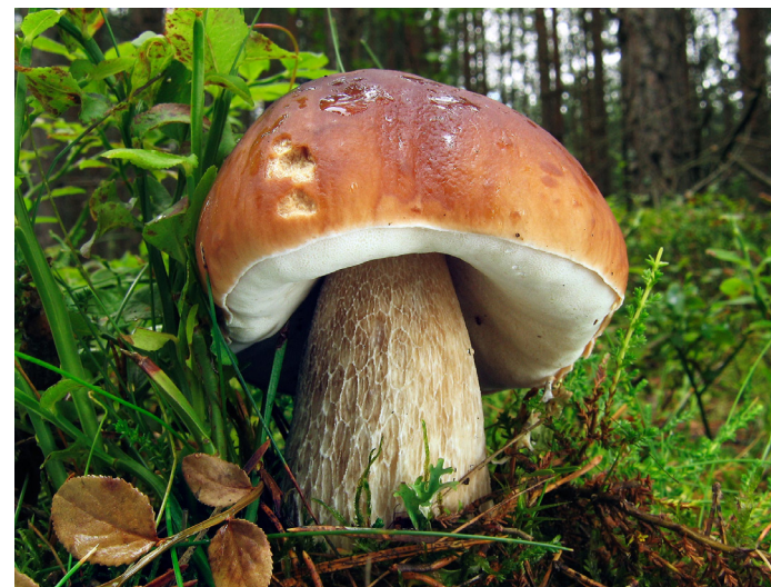
Hřib smrkový.

Děti, chodíte do lesa na houby? Umíte správně rozeznat, které si můžete vzít do košíku? Poznáte i některé jedovaté? Pokud se chcete zdokonalit ve znalostech o houbách, přijďte se podívat na některou naši výstavu. Jedna z nich se nazývá Houby na hrázích rybníků v jižních Čechách. Zde můžete vidět fotografie plodnic hub a také plodnice, které vypadají jako ty v přírodě. Také si zde o houbách můžete mnoho přečíst. Druhá tradiční výstava hub je velmi oblíbená. Můžete tu vidět opravdové houby jako v lese a dokonce je tu přítomen odborník, mykolog, který vám může leccos vysvětlit. Nebo si přinesete neznámou houbu a tady se o ní dozvíte vše potřebné. Kdo rád houbaří, jistě rád přijde.