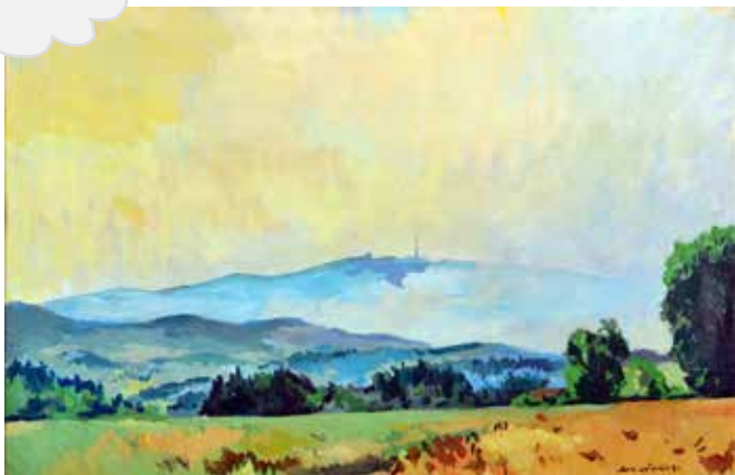
Obrázek: Novák Āda, Kleť, 1972, 65x100, olej, plátno, Muzeum ĀK

Kleť jako nejvyšší hora Blanského lesa odedávna lákala malíře k jejímu výtvarnému zobrazení. Nejen Kleť, ale i malebná místa pod ní a v okolí. Na výstavě můžete obdivovat kouzelné obrazy mnohých jihočeských malířů. Možná vás tento zážitek zláká ke skutečné návštěvě Blanského lesa a Kleti, nebo se zapojíte do našeho edukačního programu pro školy „Krajinomalba lehce.“ Pokud jste na Kleti ještě nebyli, rozhodně stojí za to na ni vyšplhat!