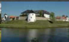
Tvrz Žumberk u Nových Hradů