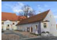
Velešín – středověký dům U Kaničůrků

Více informací naleznete na http://bit.ly/1XYhyg8 Soutěž probíhá od 1. července do 30. září 2016