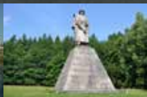
Památník J. Žižky z Trocnova