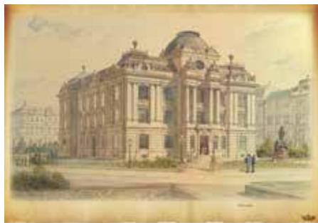
Obrázek: nerealizovaný návrh budovy muzea.

Naše muzeum slaví narozeniny! Je mu už 140 let! V roce 1877 založili zámožní budějovičtí měšťané Musejní spolek a začali shromažďovat první historické předměty. Muzeum sídlilo nejprve na náměstí v domě č. p. 16, později se sbírky přestěhovaly do domu U Tří korun vedle radnice, kde se sbírkové předměty vystavovaly. Protože jich přibývalo, nechalo město postavit novou budovu v novorenesančním slohu.