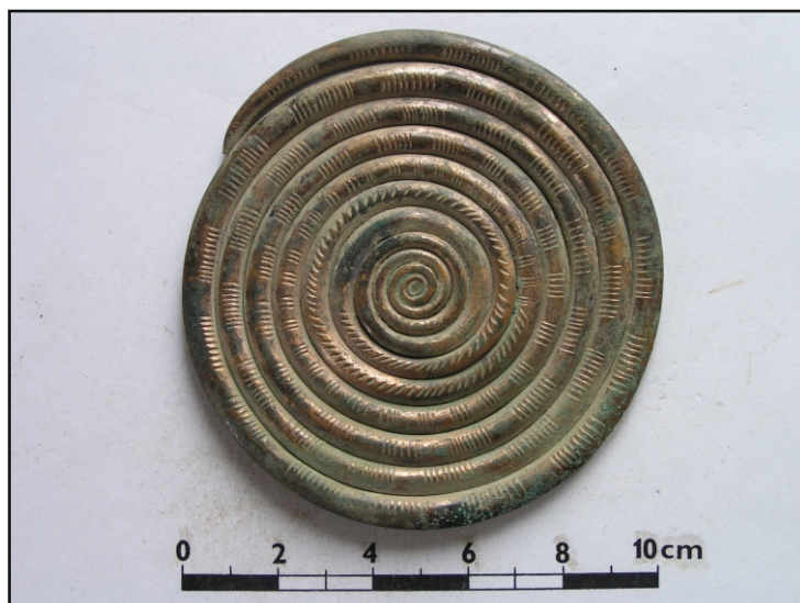
Růžice nalezená v Olešné (mladší doba bronzová cca 1250 - 1100 př. n. l.)

Těmto hromadným nálezům říkáme odborně depoty , lidově pak poklady. U většiny depotů není zřejmé, z jakého důvodu byly uloženy. Jednou z možností mohlo být dočasné uložení a z nějakého důvodu již nebyly depoty ze země vyzvednuty (úkryt majetku v době nebezpečí, preventivní důvody). Druhou možností vysvětlení je, že se jednalo o trvalou obětinu nějaké duchovní síle, božstvu.