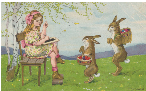
Starodávná velikonoční pohlednice z muzea v Netolicích

Můžete si tady prohlédnout kraslice či pomlázky i předměty s tematikou pašijového týdne. Zajímavé jsou i staré velikonoční pohlednice. Je možné si vyzkoušet hrát kuličky nebo obdivovat rekordní třímetrovou pomlázku či jedinečný strojek na štráfkování kraslic.