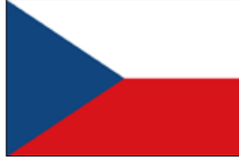
ČSR 1920 – 1992, ČR od 1993