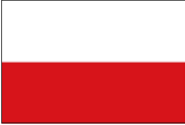
ČSR 1918 - 1920